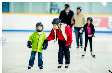
Patinage libre intérieur