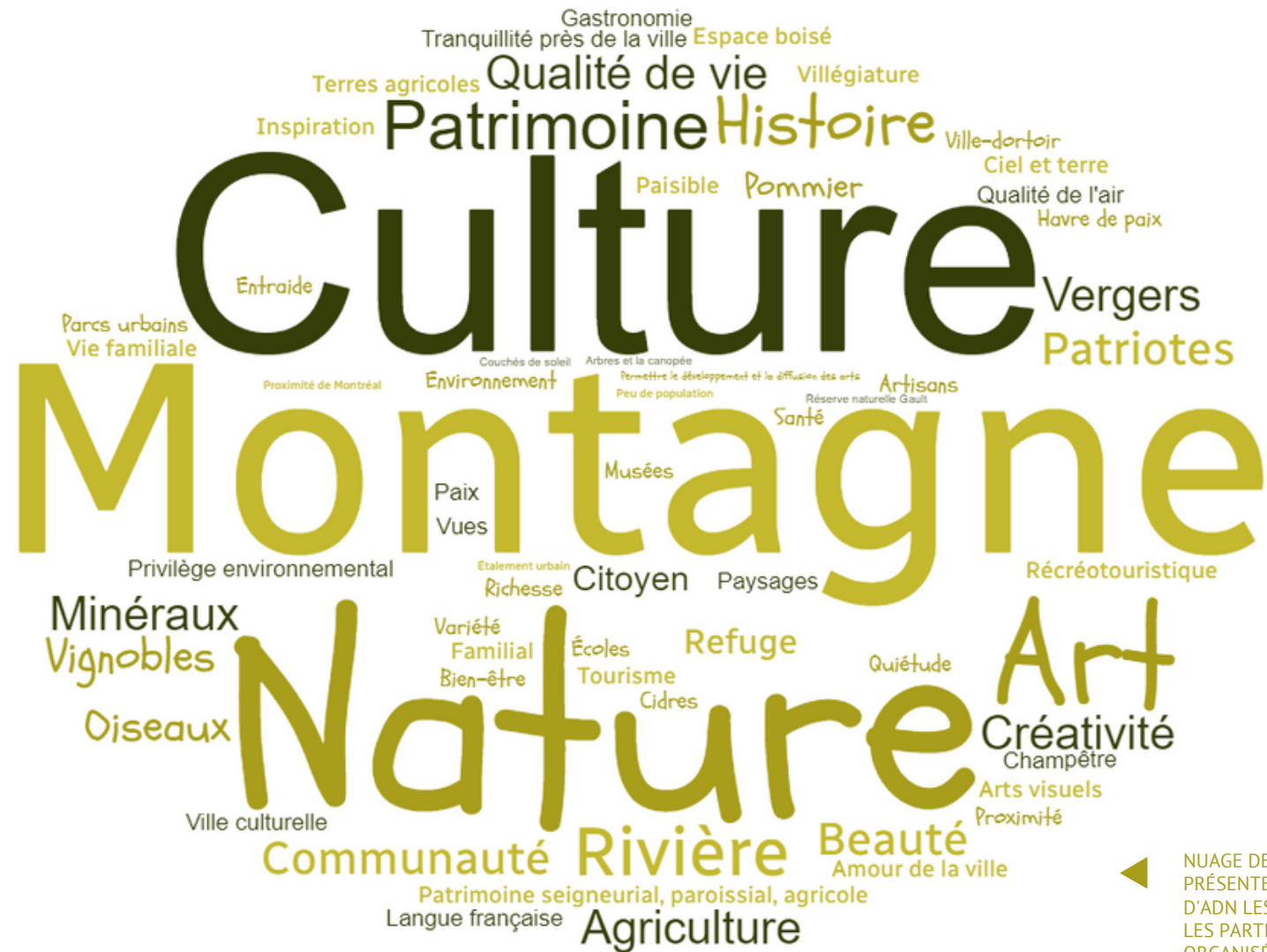
◀ NUAGE DE MOTS QUI PRÉSENTE LES ÉLÉMENTS D'ADN LES PLUS CITÉS PAR LES PARTICIPANTS, ORGANISÉS EN FONCTION DE LEUR OCCURRENCE.

QUEL EST L'ADN DE LA VILLE DE MONT-SAINT-HILAIRE ET COMMENT L'INFUSER DANS LE FUTUR DU MANOIR?